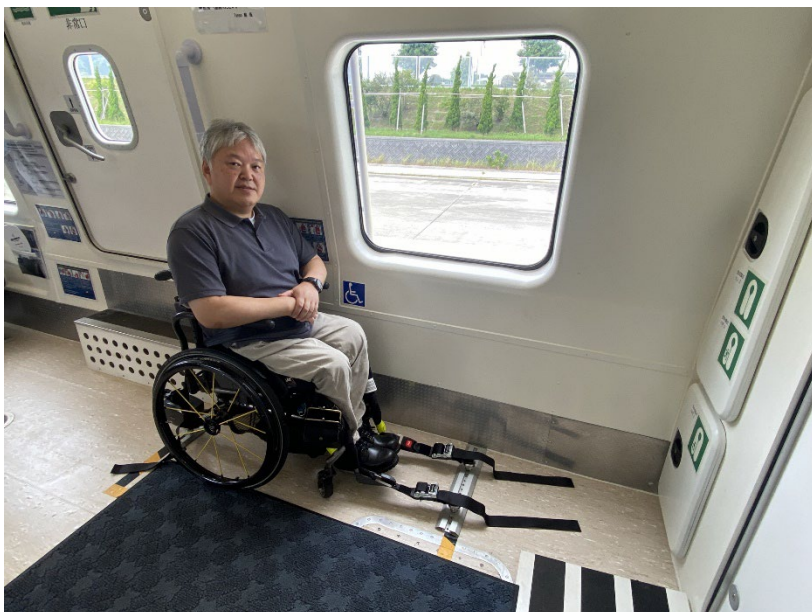
写真：乗船し、車いすを固定して座っているところ。左側手前に大きな窓があります。

室内は椅子がずらっと並んでいて、車いすスペースは前方の左右2箇所にあります。バスと同じような固定方法でした。座席に移乗できる人は、最前列の椅子に座れますので、車いすのまま2台、移乗席が数席、という感じでした。