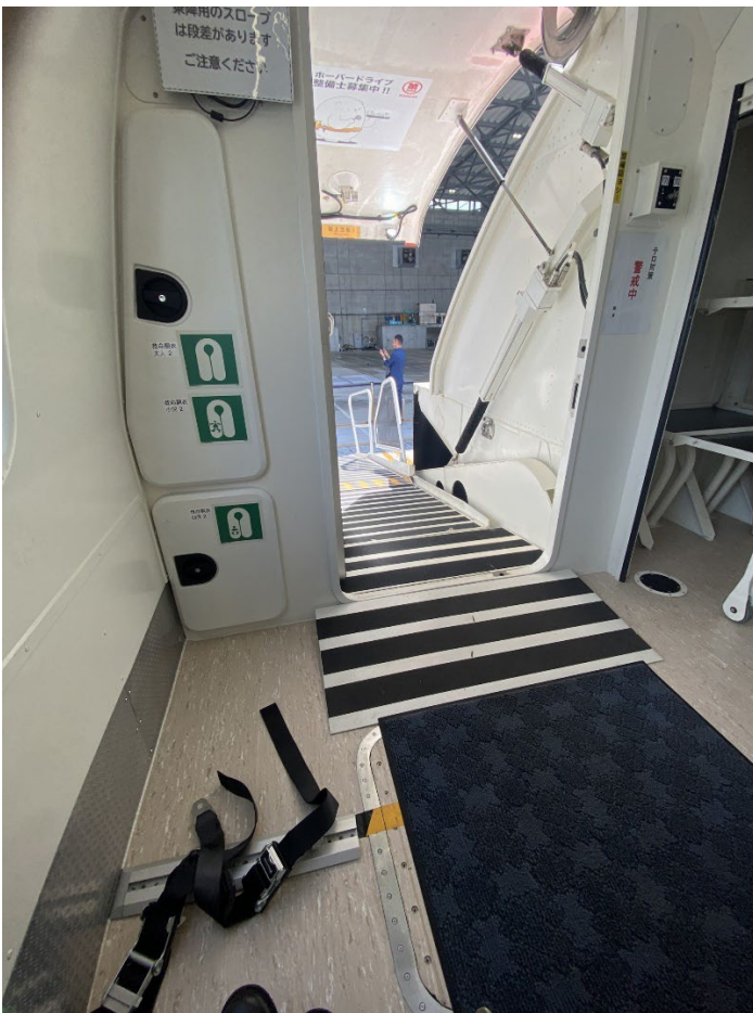
写真：ホーバークラフトの内側からみた搭乗口スロープ。