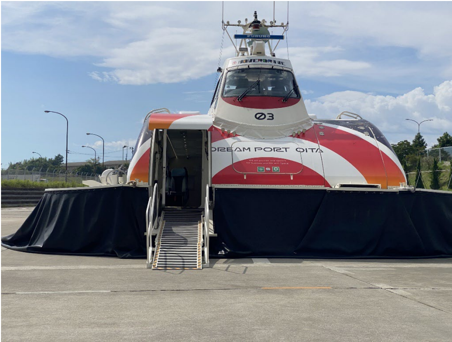
写真：陸上でのホーバークラフト。搭乗口のスロープ（上り）が設置されています。