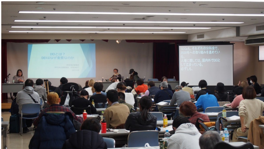
写真:会場全体の様子

第 14 回 DPI 障害者政策討論集会 (2025 年 11 月 29 日 (土)、11 月 30 日 (日)) の 2 日目の国際・障害女性部会合同分科会では「DEI (多様性・公平性・包摂性) は障害分野でどう生かされるか」をテーマに、DEI の基本的な考え方を整理しながら、障害のある女性らが直面する複合差別の課題との関連を考察しました。