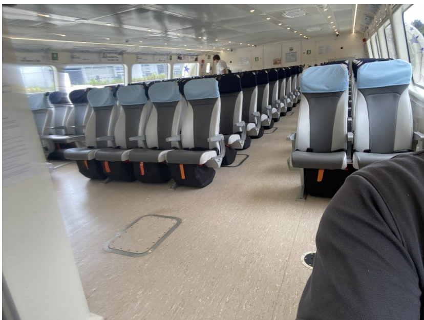
写真：車いす固定席に座って、左の肩の後ろを撮影しています。客席の様子は、左2席、真ん中2席、右2席、それぞれ8列程度（あるいはそれ以上）あります。