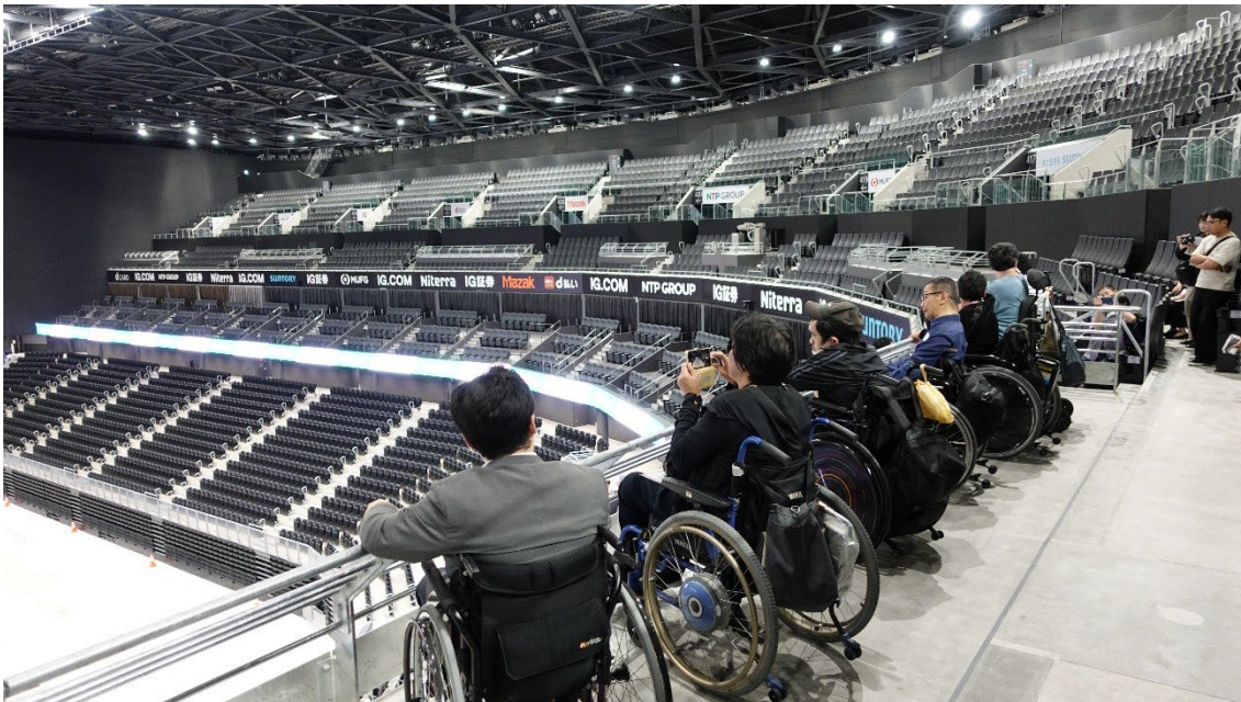
写真：愛知国際アリーナの観覧スペースからアリーナを見る車いすユーザー6人ら。

午後は3グループに分かれてIGアリーナを約二時間かけて視察しました。車いすユーザーのために客席を取り外せるVIPルームの見学等、国内最大級のアリーナをじっくりと視察させていただきました。