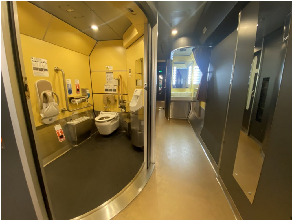
写真：車内からみたトイレのドア（開いたところ）。

バリアフリートイレは介助者も一緒に入れるくらいの十分な人さがありました。新幹線より広く、JR 東日本の特急あずさと同じくらいです。