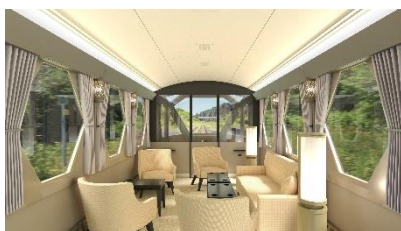
△コックピットスイート (イメージ)

現行のスペーシアを継承しながらもより上質な空間となった個室をはじめ、全6種類のシートの中からお客様それぞれの旅行スタイルに合うものを選んでいただけます。