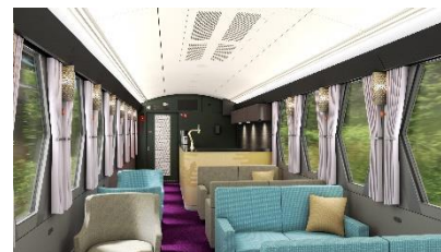
△コックピットラウンジ (イメージ)