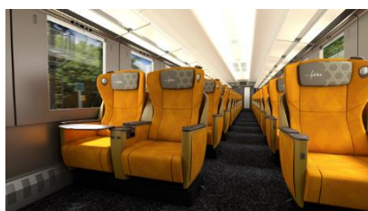
△プレミアムシート (イメージ)