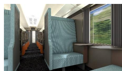
△ボックスシート (イメージ)