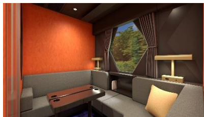
△コンパートメント (イメージ)