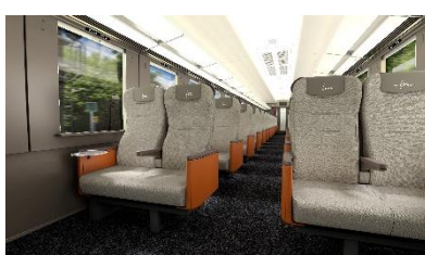
△スタンダードシート (イメージ)