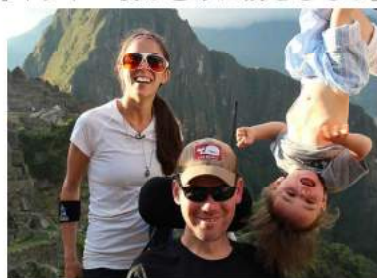
© 2016 Dear Rivers, LLC ヒューマンラストシネマ有楽町&渋谷にて全国順次公開中