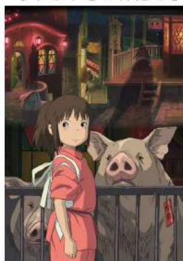
千と千尋の神隠し